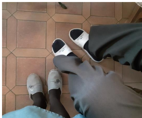
et en pantoufles !