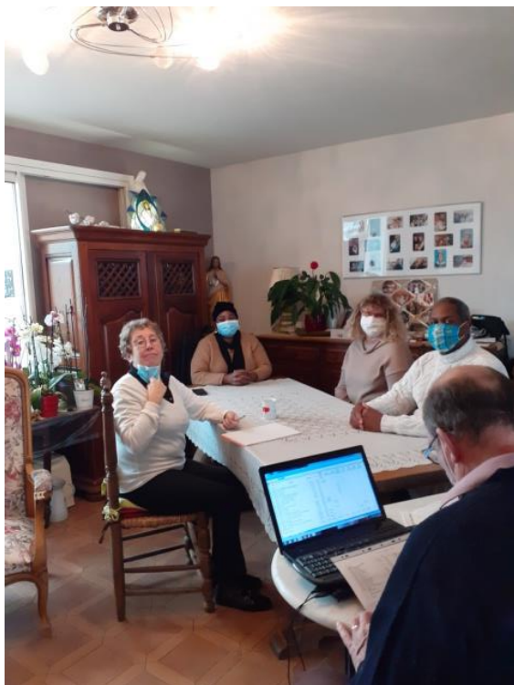
Assemblée Générale minimale